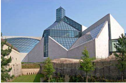
« Le MUDAM. »