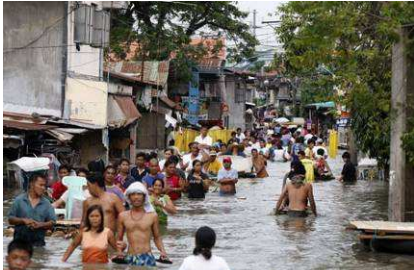
« Une rue de Manille après le typhon ».

Me voilà aux Philippines ! Je suis arrivé le 2 septembre vers 5h30, heure locale Le premier soir, nous avons été accueilli par les jeunes de Fondacio - Asie. Le lendemain, nous avons fait un petit tour du quartier (découvrir la piscine, le supermarché, etc). Nous sommes allés aujourd'hui pour la première fois à Payatas**. Le plus frappant n'a pas été la pauvreté, ni la saleté, mais l'odeur... dans certains endroits de Payatas, ça pue ! Mais, les gens y sont chaleureux et accueillants. Je galère un peu avec l'anglais, mais ça va !