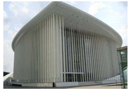
« La Philharmonie. »

La Philharmonie est construite à quelques pas du musée et attire un large public mélomane venant d'au-delà des frontières grand-ducales. Le bâtiment touche par sa couleur blanche et sa forme elliptique d'ensemble. La salle de concert, entourée de 823 colonnes et les deux annexes accolées aident à rompre avec la monotonie des immeubles environnants. L'alignement des colonnes donne une impression de mouvement. A noter que le foyer représente 10% de la superficie totale qui est de 22000 m 2 .