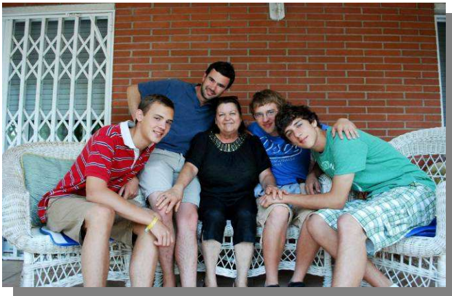
« 'Gus' et ses amis entourant 'la Mama' ».

Quand on me demande ce que j'ai fait pendant les vacances, je réponds fièrement : « j'ai été au JMJ à Madrid ». Les autres automatiquement me disent : « ce n'est pas le truc avec le pape ça ? ». Déçu de ce raccourci vite fait, je ne peux m'empêcher d'en dire plus. Car en effet, les JMJ, c'est très loin d'être simplement un rassemblement autour du pape. Personnellement, je ne l'ai vu qu'une fois, après certes 4h d'attente, ainsi que lors de la messe papale où je ne le voyais que sur grand écran, et où l'on était plus préoccupé par l'orage que par la messe en soi. Ça fait donc peu de matériel pour raconter la réelle immensité des JMJ.