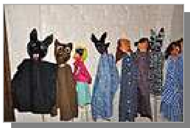
« Les marionnettes des enfants. »

Un thème riche pour tous. Les enfants ont ensuite réalisé des marionnettes pour mettre en scène leur propre histoire, pendant que leurs parents dialoguaient en couple sur les ressorts expérimentés pour traverser les épreuves de la vie à deux. Temps de partage délicats parfois mais soutenus par la bienveillance et le désir de chacun d'avancer sur le chemin de l'aventure du couple. Car sur ce chemin une clé pour avancer est bien l'écoute en profondeur et l'accueil sans jugement de ce que vit l'autre.