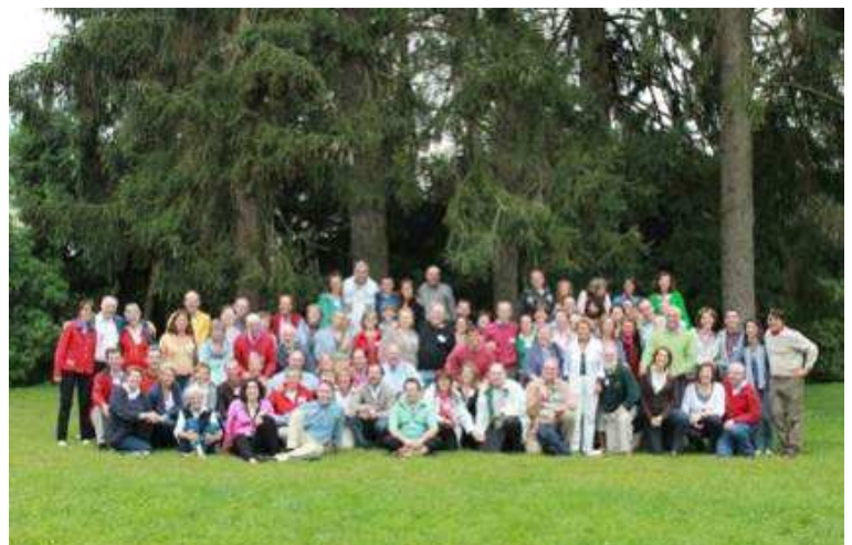
« L'ensemble du groupe de Ciney 2011 »

Nous sommes repartis avec énormément d'enthousiasme, tout en sachant que nous avons un travail énorme à réaliser pour améliorer notre communication en couple. Plutôt que de nous enfoncer dans une spirale négative, une voie s'ouvre devant nous, et elle donne un nouvel élan à notre couple.