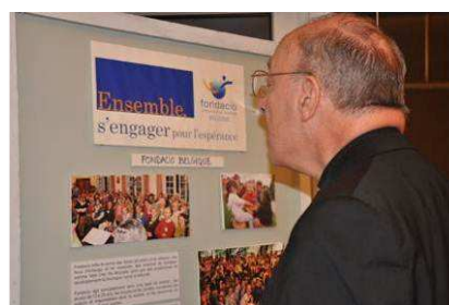
« La présentation des activités de Fondacio en Belgique. »