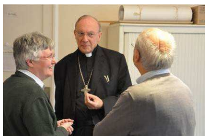
« Avec l'ancien et la nouvelle responsable de Fondacio en Belgique. »