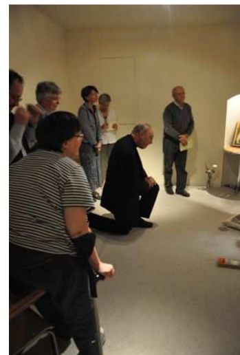
« A l'oratoire. »