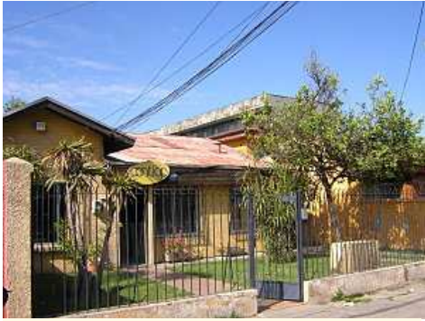
Le bureau de Contigo à La Cisterna

Comme vous le savez peut-être, je suis dans deux projets différents. La banque de microcrédit Fundacion Contigo (3jours et demi par semaine) et un Hogar Mas Digno, un projet de Fondacio Chili (un jour et demi)